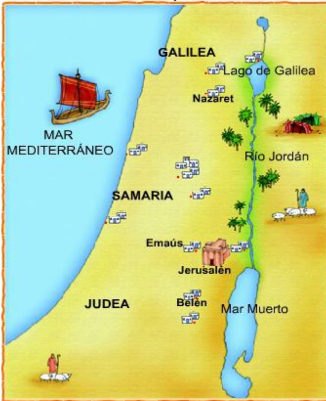
Palestina en tiempos de la Biblia

El ministerio de Jesús, se desarrolló en esta tierra, conocida como Palestina; en la ilustración podemos apreciar el lago de Genesareth, el lago de Galilea, llamado también, Mar de Galilea, el río Jordán y el Mar Muerto; conocido también como el mar salado o el mar de la sal; cerca del cual se estima que la esposa de Lot quedó convertida en estatua de sal.